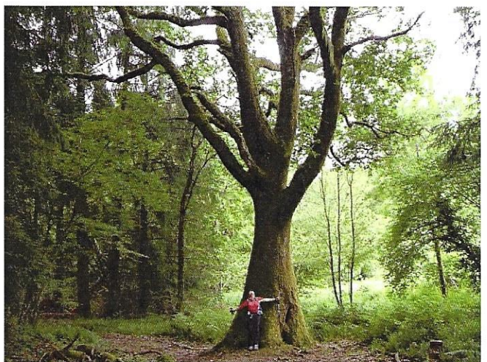
Elevage de moutons et chêne remarquable près de l'École d'Agriculture du Nivot (Lopérec)