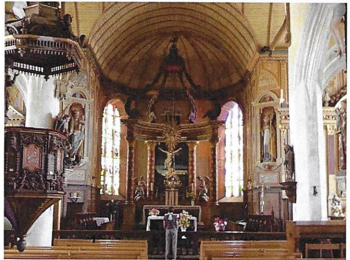
L'Eglise Notre-Dame et Saint-Tugen de Brasparts de style Renaissance