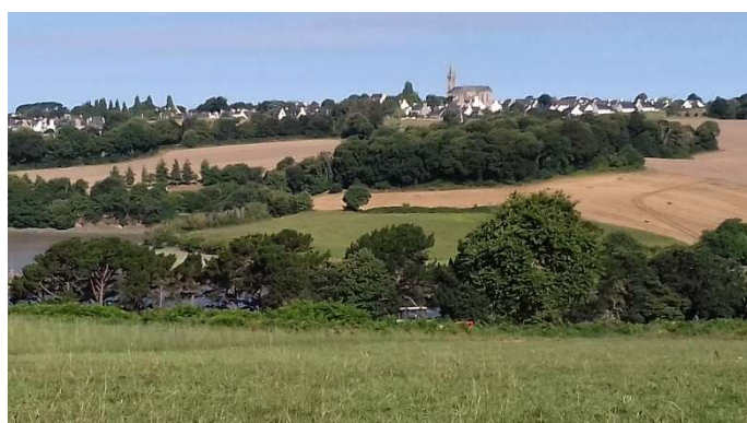
Tredarzec (rive droite du Jaudy)