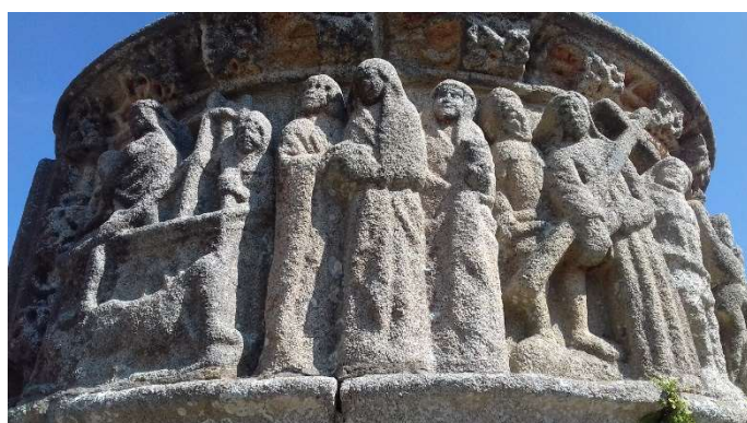
Eglise de Pleubian