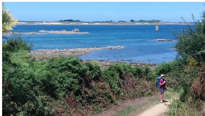
Le Banc de la Pie (Sortie de l'estuaire du Jaudy)