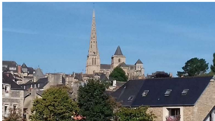
Port de Treguier