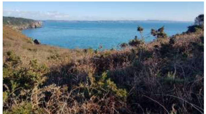
Cap de la Chèvre