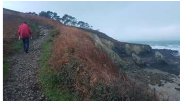
Plage de Goulien