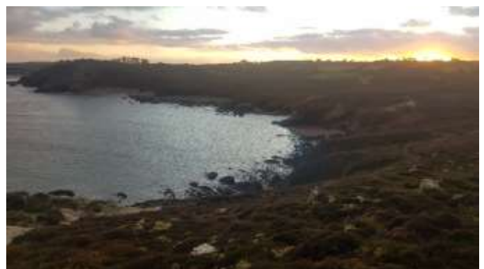
Anse de Dinan