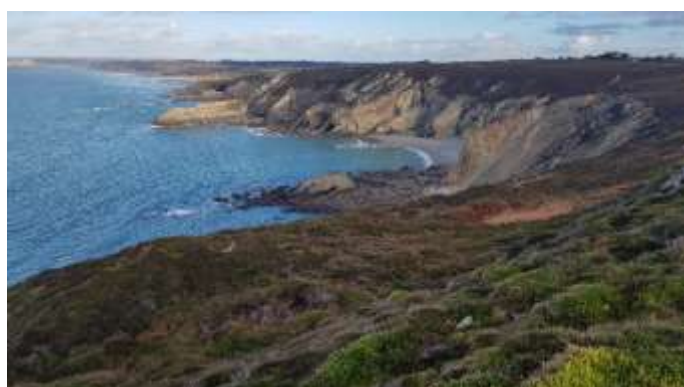
Pointe de Kerroux