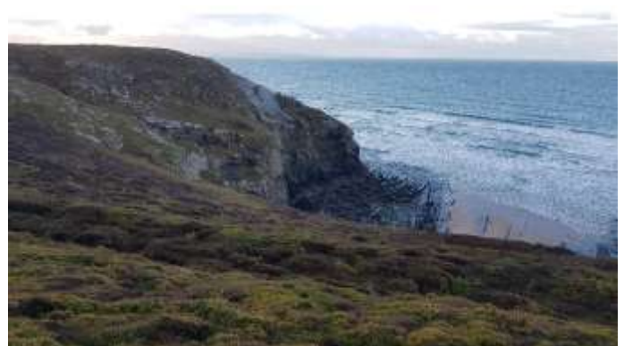
Pointe de Lostmarc'h