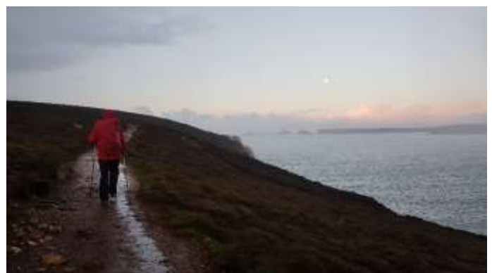
Pointe de Dinan