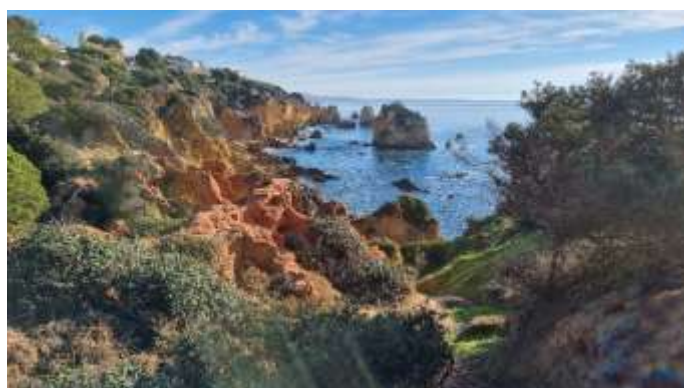
Vue sur les rochers de Risco