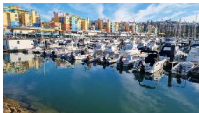
Marina de Albufeira