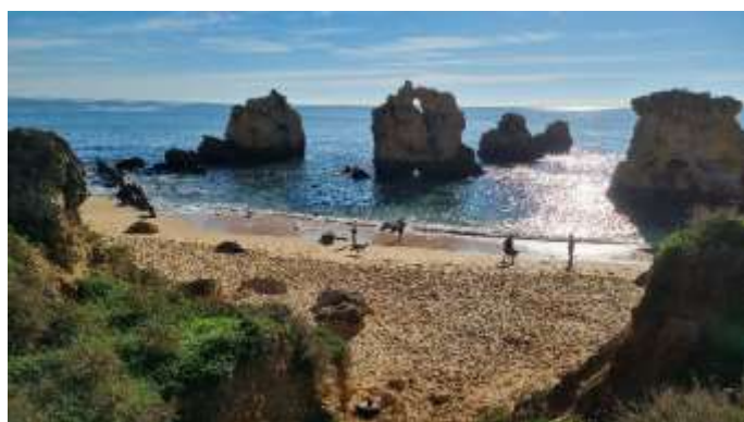
Plage des Arriffes