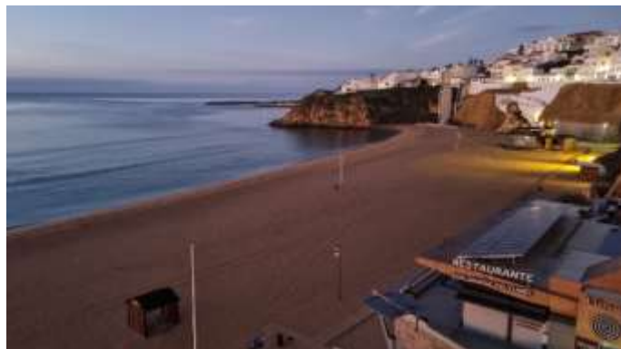
Lever de soleil sur la plage d'Albufeira