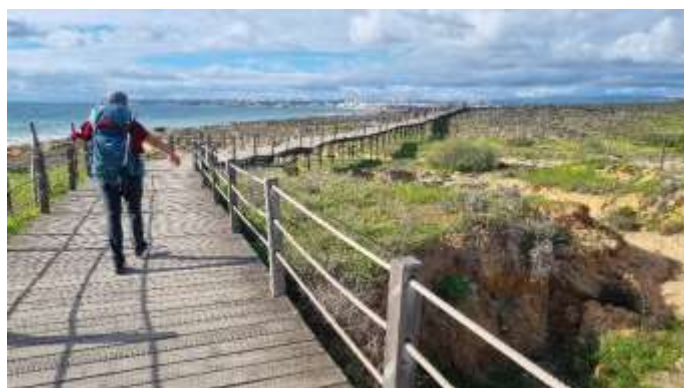
Plage de Galé