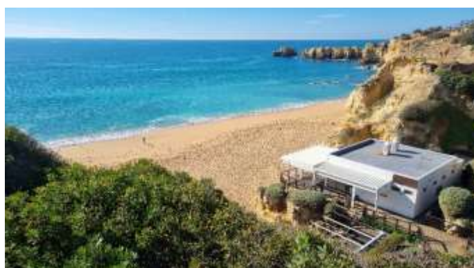
Plage de Coelho