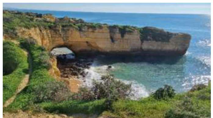
Arc de Sao Rafael