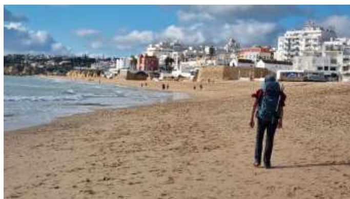
Grande Plage d'Armação de Pêra