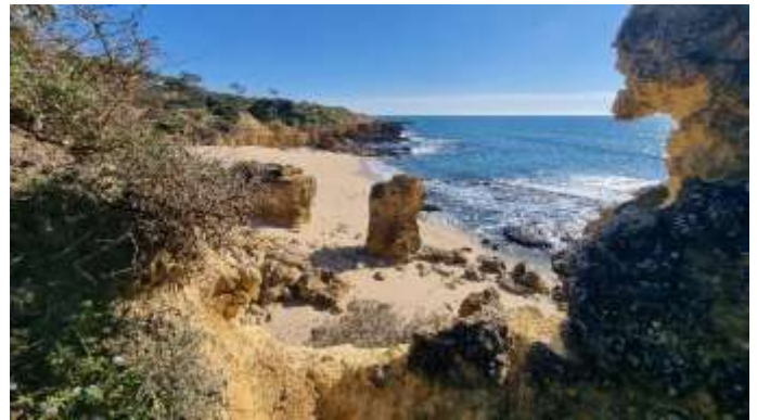
Eperon de Evaristo