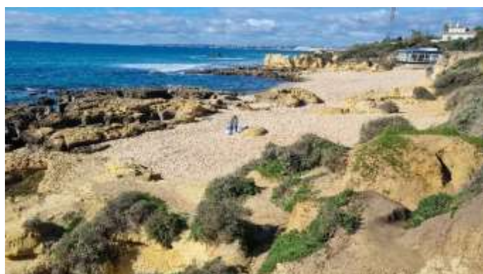
Plage Manuel Lourenço