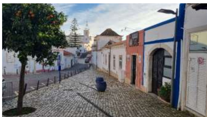
Vieille ville d'Albufeira