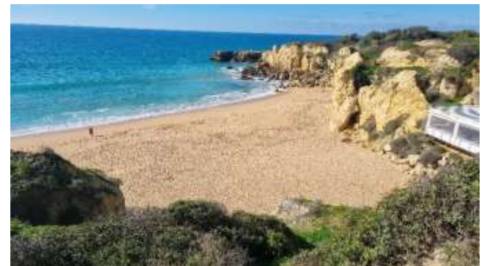
Plage du Castello