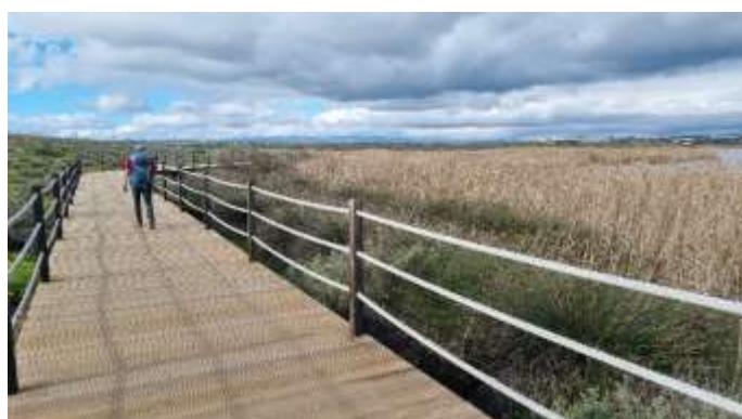
Dunes de Salgados