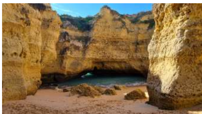
Plage secrète près de Ponta Grande