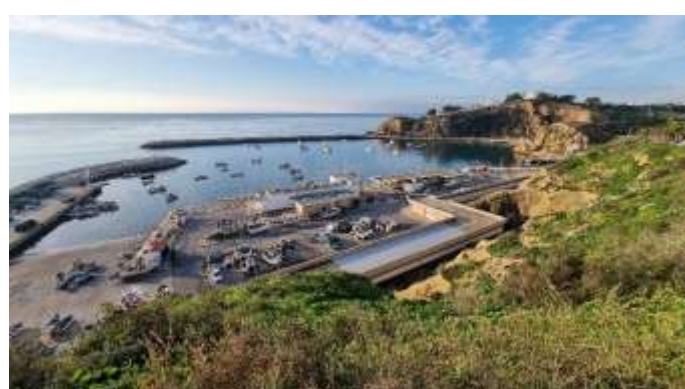
Port de Albufeira