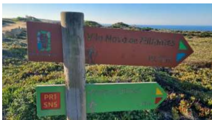
Chemin historique et Chemin des Pêcheurs de la Route Vincentine