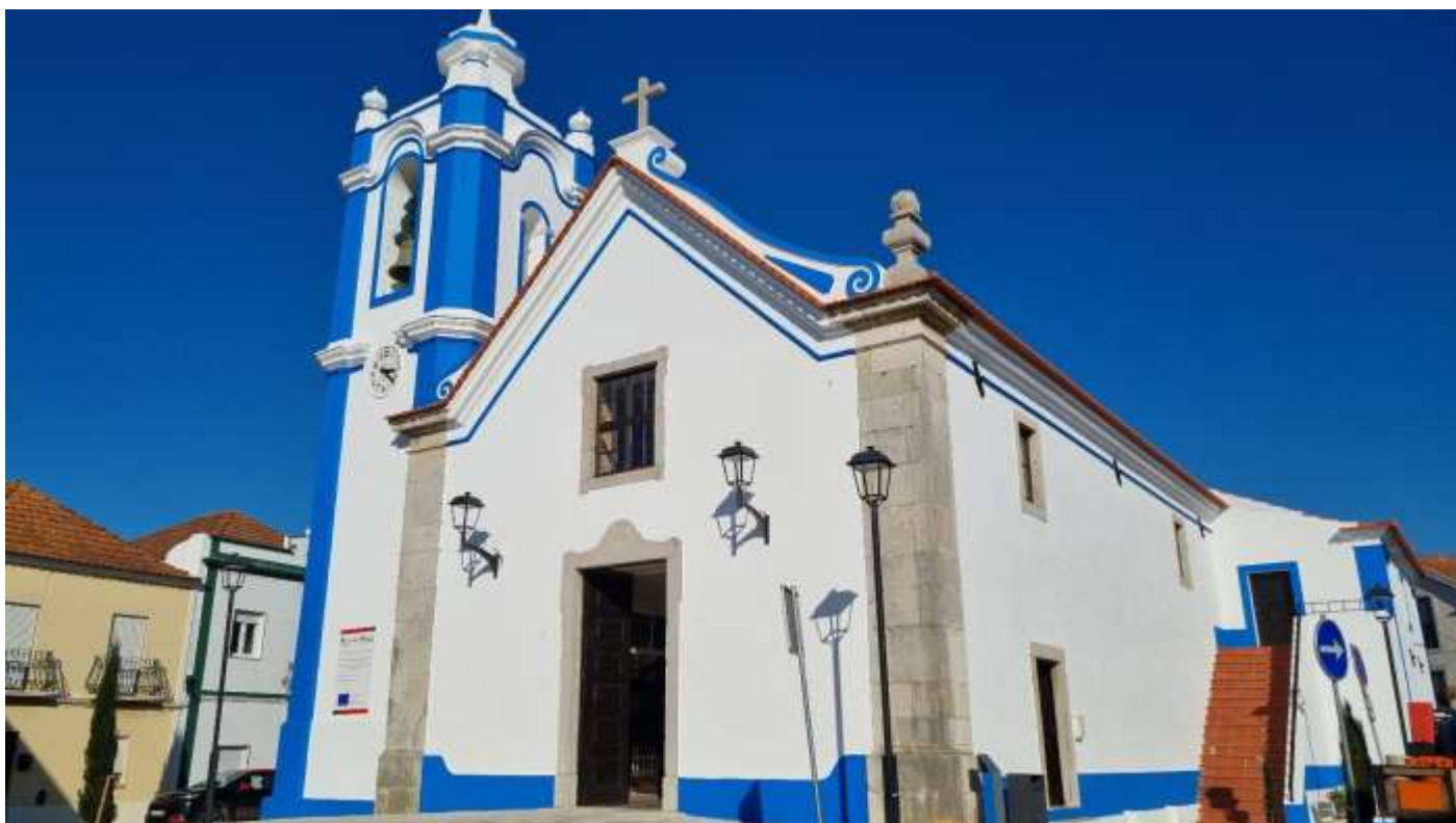
Cercal do Alentejo