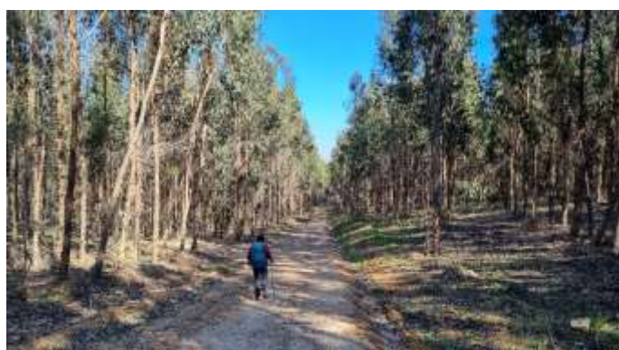
Forêt d'Eucalyptus de Cercal do Alentejo