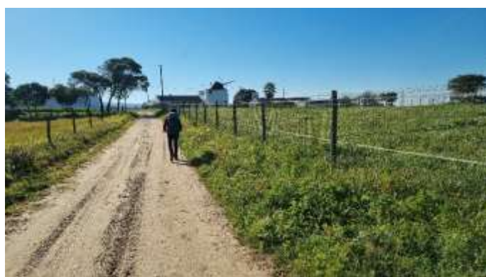
Moulin de Cabaça de Cabra